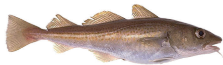
Morue Gadus morhua

Une étude récente a montré qu'en mer Celtique, environ 40% des morues atteignent leur première maturité sexuelle à 2ans. Cette proportion augmente rapidement avec l'âge : elle est de près de 90% à 3 ans, et de 100% à 5 ans. La femelle porte un grand nombre d'ovules : de 2,5 millions pour une morue de 5 kg à plus de 7 millions à 15 kg. Les aires de reproduction des populations de morue sont bien individualisées. La plupart des morues de mer Celtique pondent en mars au large de la côte nord de Cornouaille anglaise. Des pontes notables sont également observées au large de la côte sud-est de l'Irlande et un peu en Manche Ouest. En mer du Nord, les principaux lieux de reproduction sont situés au large des côtes néerlandaises (German Bight et Dogger Bank).