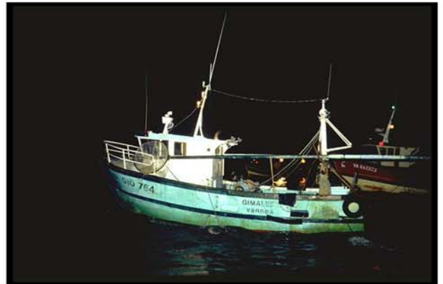
Pêche au tamis

Les bateaux qui pêchent la civelle sont, en majorité, des petites unités < à 9 m, les autres sont compris entre 9 et 12 m. (source SIH Anonyme, 2009). En 2008, 781 licences de pêche en estuaire ont été attribuées dont 99 % ayant un timbre civelle et 43 % un timbre anguille jaune. Le nombre de couple bateau/pêcheur autorisé à pêcher la civelle est en diminution au cours de ces dernières années (mise en place d'un plan de sortie de flotte anguille).